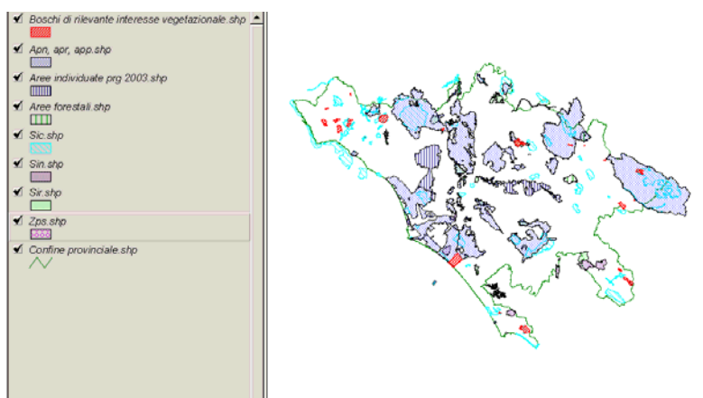
Figura A 5/n.4: Aree boschive di rilevante interesse vegetazionale e aree protette istituite.

Dall'osservazione della carta si nota come alcune aree boschive di rilevante interesse vegetazionale siano comprese nel perimetro di aree protette istituite; è il caso, ad esempio, della Tenuta di Capocotta, inclusa nella Tenuta Presidenziale di Castel Porziano, e dei boschi di Spalviera e Pozzo del Gelo, inclusi nel Parco Naturale Regionale dei Monti Simbruini.